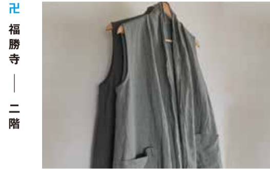
福勝寺 — 二階