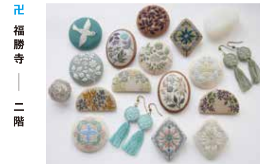
福勝寺 — 二階

季節、年齢を問わず、飽きのこない長く着ていただける服を製作しています。気に入って頂けたら嬉しいです。