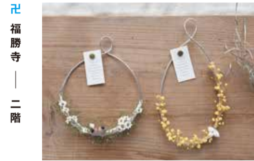
福勝寺 — 二階

オーダーを頂いて束ねる旬の生花のブーケ。¥3,300～承りますが¥5,500～がよりお花の種類が増えおすすめです。生花をお楽しみ頂きたいため、カタル葉ではスワッグやドライにする用のオーダー承りません。