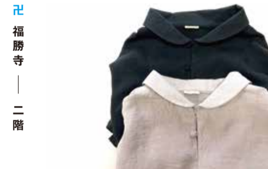
福勝寺 — 二階