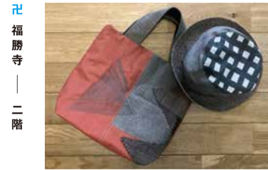
福勝寺 — 二階