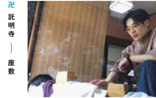
託明寺 — 座敷