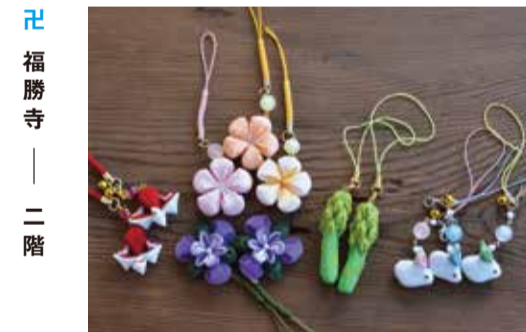
福勝寺 — 二階

うつわや、カゴ、ふきん、タオル、花器など、暮らしによりそう日用品をセレクトしています。