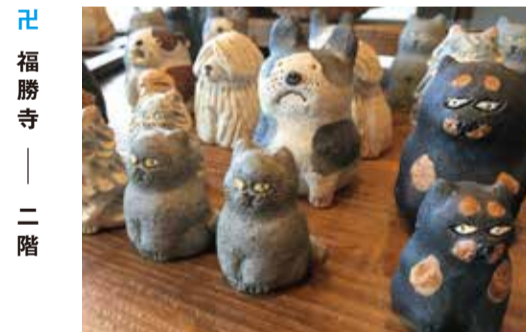
福勝寺 — 二階